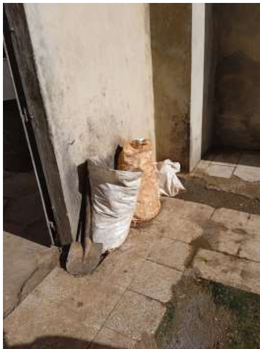
Foto25: Cantidad de desechos solidos de varios días.

d) Clasificación de los residuos sólidos para su disposición final: No se realiza la clasificación.