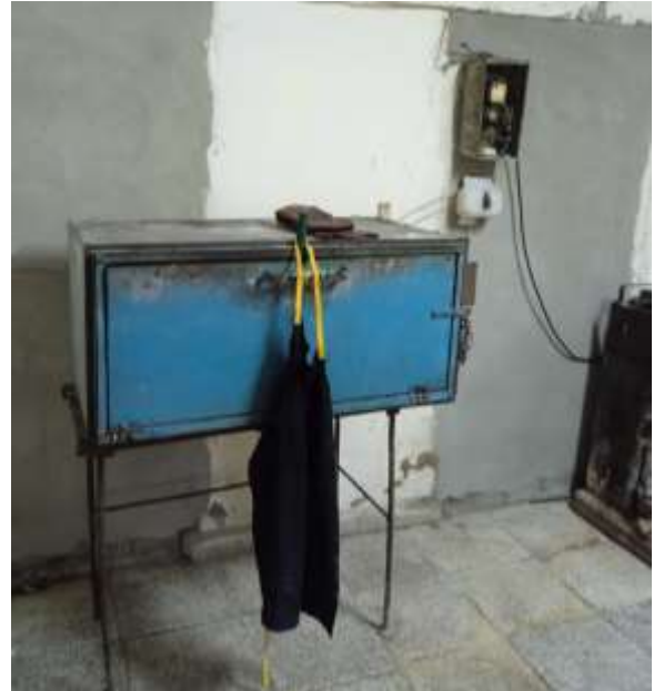
Fotos5,6: Hornos de cocción.