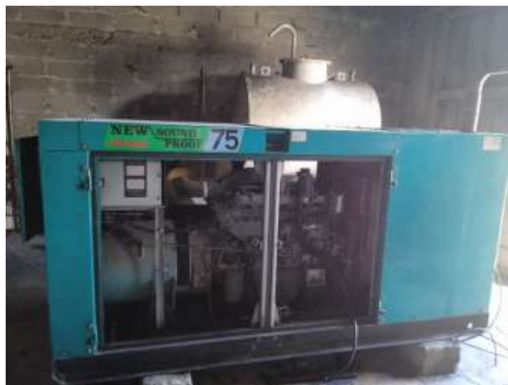
Foto24: Grupo electroenergético.