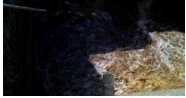
Fotos11,12: Foso de precipitación.