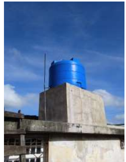
Fotos 19, 20, 21: Suministro de agua de la panadería.