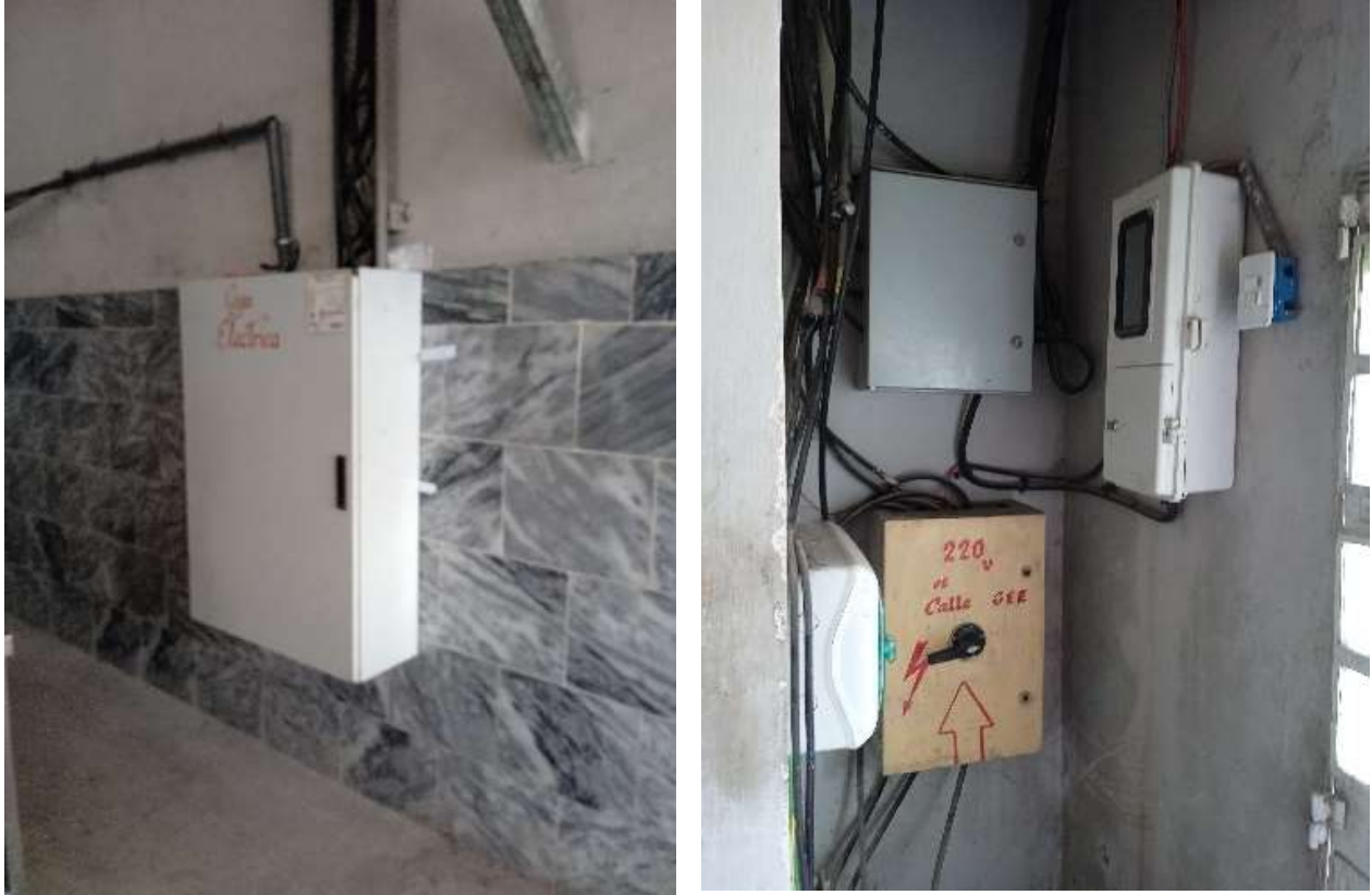
Fotos22,23: Contadores eléctricos de la panadería.

c) [E-BASE] Situación de base del consumo de energía eléctrica (en kW-h) en los procesos analizados: 170kw/ en una jornada de trabajo. Este dato es tomado de la factura eléctrica de hace 6 meses.