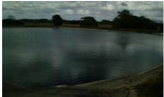
Foto15,16: Lagunas de oxidación.