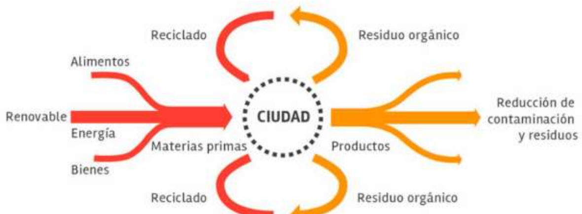
Figura 1: Metabolismo urbano circular. Fuente: Pallasco (2023)