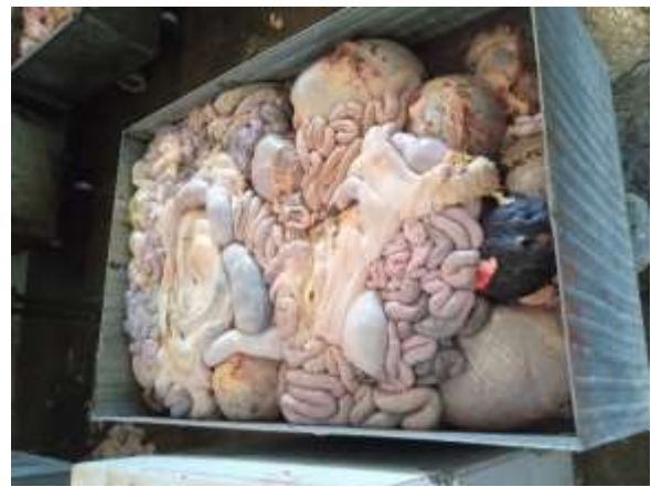
Fotos17,18: Residuos para alimentación animal.