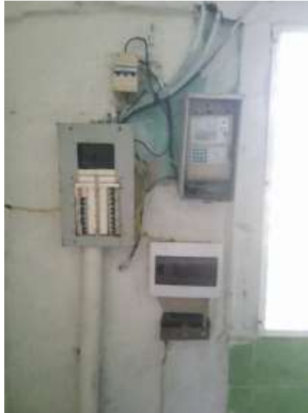
Foto4: Contadores eléctricos del centro de elaboración.

Dado que el horno y la nevera están dedicados específicamente a dos procesos (cocción y almacenamiento), estimaremos el consumo de energía de otros equipos asociados a los demás procesos.