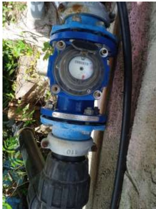
Foto10: Metrocontador.