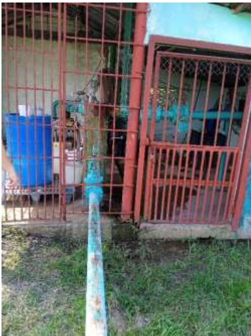
Foto9: Pozo.

c) Procedencia del agua de entrada: El centro es abastecido de agua mediante un pozo propio a través de un sistema de bombas sumergibles a 29 metros de profundidad, actualmente la bomba que se encuentra funcionando tiene una capacidad de 16 L/h \approx 58 m 3 /h la cual consume 33kW/h y trabaja un promedio de 16 horas diarias los días laborales, debido a problemas de salideros y malas prácticas de los operarios lo cual provocaba un excesivo gasto de agua y por ende una pérdida económica. El agua es impulsada por la bomba hasta un tanque elevado a 30 m de altura que cuenta con una capacidad de 200 m 3 , siguiendo su recorrido por gravedad hasta un metro contador instalado en la entrada de la industria y del cual se alimentan todas las áreas.