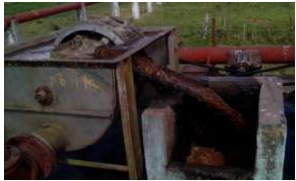
Fotos13,14: Cribas.