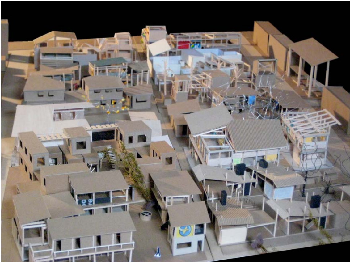
Maquette de la charrette sur l'habitat évolutif en Côte d'Ivoire, réalisée par l'atelier mgpa.