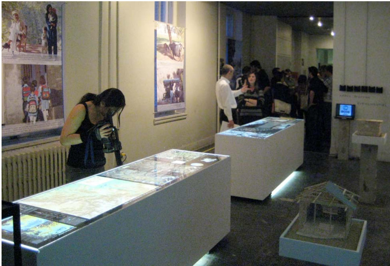
Exposition de l'atelier mgpa sur les modes d'habitation dans la région du Chachemire.

- Cette année, l'atelier mgpa a rejoint l'École d'architecture de l'Université Ryerson pour explorer ensemble des solutions innovatrices pour améliorer la reconstruction des habitations à la suite du tremblement de terre de 2005 en Cachemire. Préalablement à la préparation de solutions architecturales, l'atelier a préparé en février 2008 une exposition sur les modes d'habitation dans la région Pakistanaise du Cachemire.